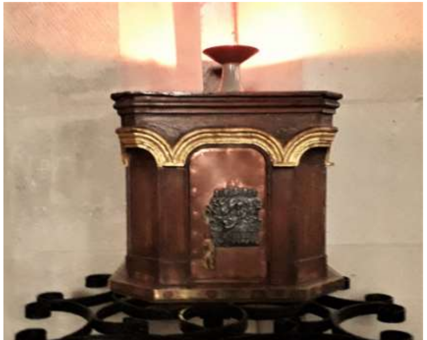
Grand pied de croix restauré par M TENTEL