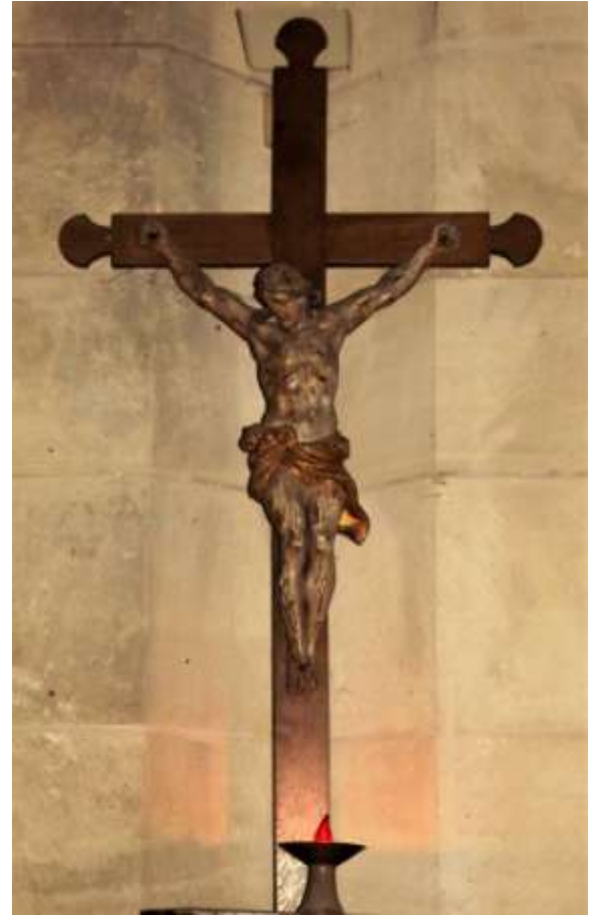
Christ en Croix du XV ème siècle